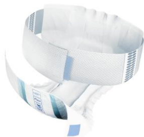
【ベルト部位 オモテ面】